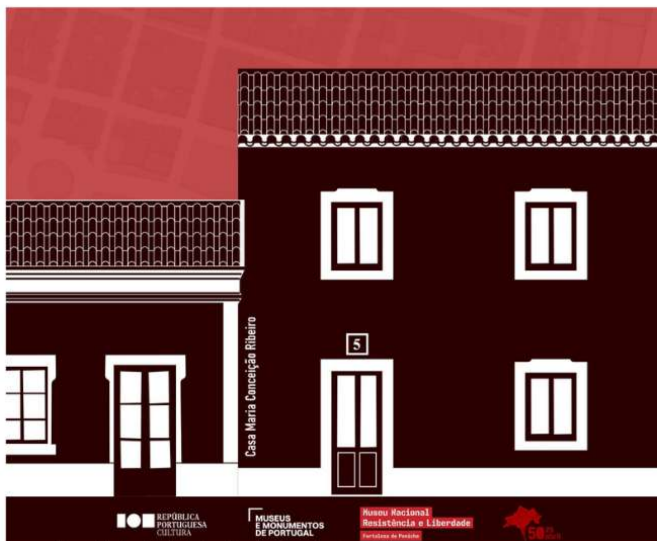
Imagem: Museu Nacional Resistência e Liberdade Fortaleza de Peniche