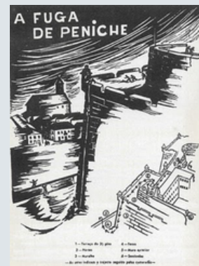
Ilustração de Margarida Tengarrinha